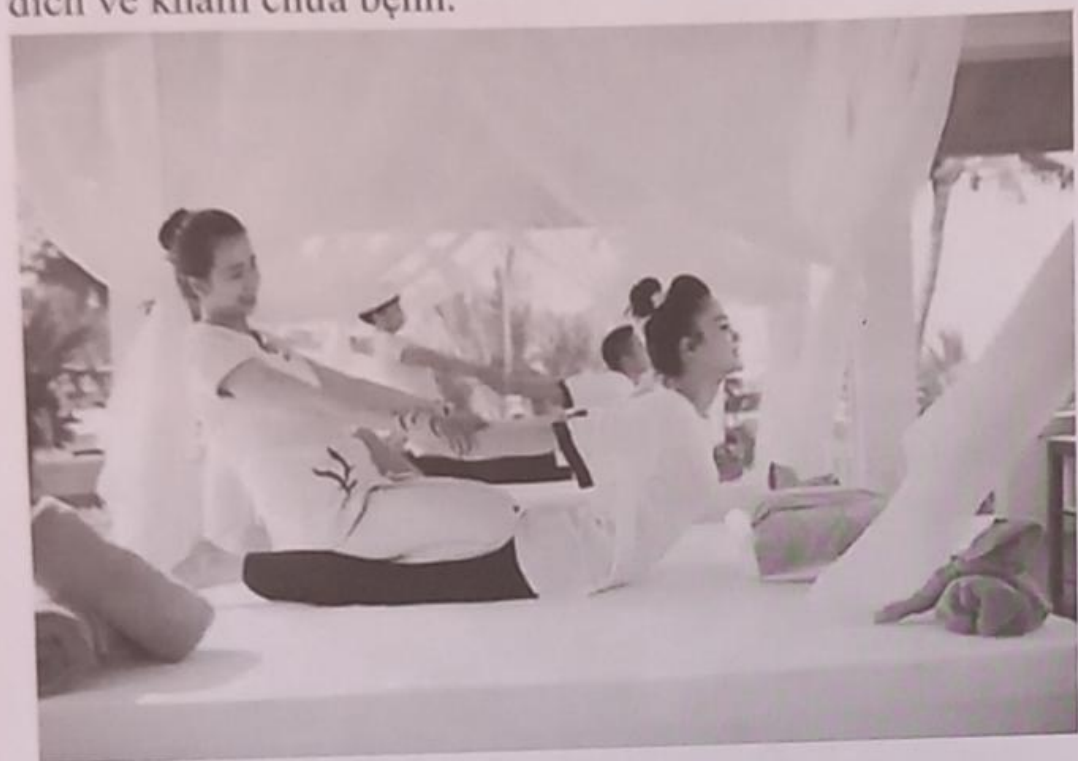
Hình 1.1. Dịch vụ chăm sóc sức khỏe cho du khách tại khu nghỉ dưỡng

trong lành, mát mẻ giúp khách du lịch nâng cao sức khỏe và tinh thần của mình. Và việc kết hợp với các tiến bộ y học trong cải thiện sức khỏe con người đã tăng sức hấp dẫn với khách du lịch trong các chuyến du lịch kết hợp với mục đích về khám chữa bệnh.